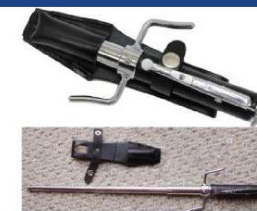
Gậy đa năng 3 khúc