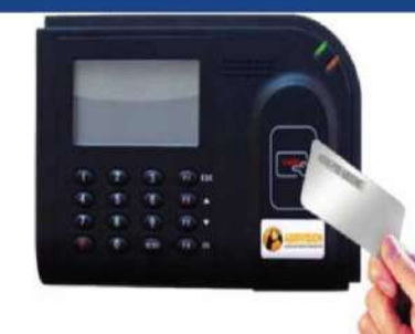
Máy quét thẻ xe thông minh

Hệ thống quản lý của công ty được áp dụng theo tiêu chuẩn an ninh hàng đầu, hàng năm được kiểm tra về chất lượng quản lý bởi những công ty quản lý tiêu chuẩn chất lượng.