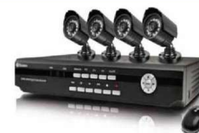
Hệ thống camera giám sát