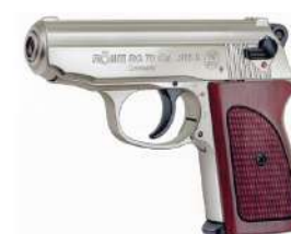
Súng bắn đạn cao su