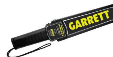
Máy dò kim loại bằng tay