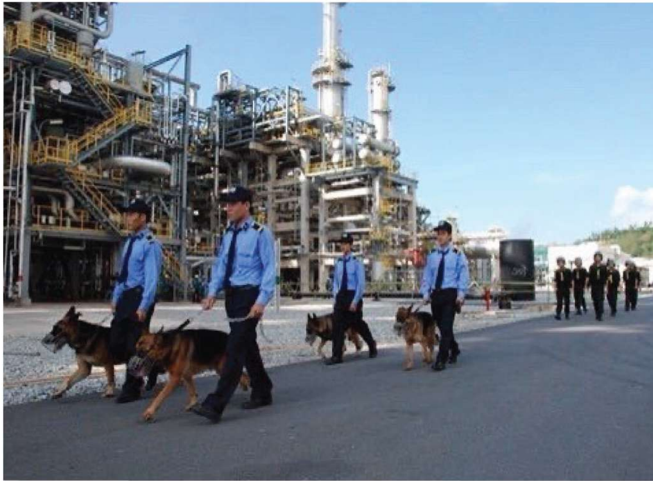
Nhân viên bảo vệ Long Hải SC sau khóa đào tạo hoàn toàn có đủ điều kiện và kỹ năng sử dụng Công cụ hỗ trợ trong công tác giữ gìn An ninh trật tự khu vực bảo vệ và phòng chống tội phạm tại tất cả các mục tiêu được giao phó.